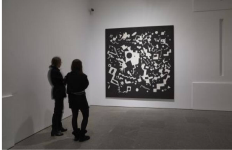
Vista de sala de la exposición Miguel Ángel Campano. D'après Museo Nacional Centro de Arte Reina Sofía. Noviembre, 2019.

No es casual el título de la muestra, que se refiere a esos artistas "a partir de" los que Campano compuso sus obras. Por eso viendo la retrospectiva, ordenada de manera cronológica y compuesta por más de un centenar de obras, asistimos de alguna manera a la evolución del arte en las últimas décadas. Fue el último proyecto en el que el artista participó antes de fallecer, hace un año.