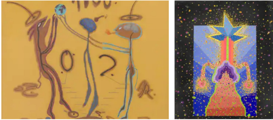
A TODO COLOR. Arriba, 'Kaenia Overa' (1973). Sobre estas líneas, detalle de 'Evruugo Mental State'. A la derecha, 'Starea' (1970)