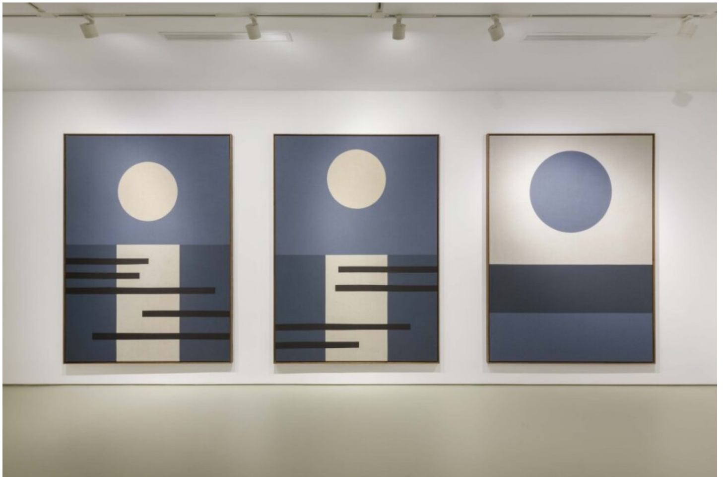
Vista de la exposición Nubes (verde). Maisterravalbuena, 2023