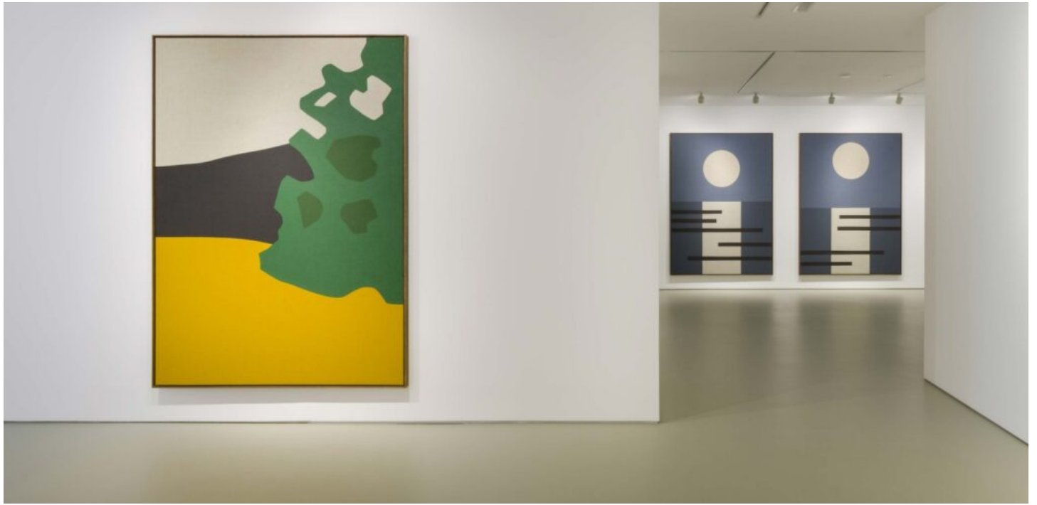
Vista de la exposición Nubes (verde). Maisterravalbuena, 2023