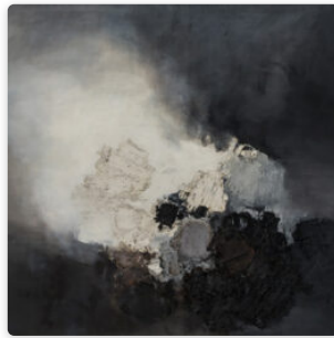
Luis Feito, gestos íntimos