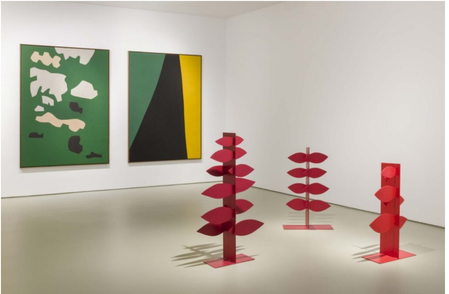
Vista de la exposición Nubes (verde). Maisterravalbuena, 2023