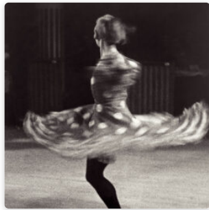
Ilse Bing en la historia de tres ciudades