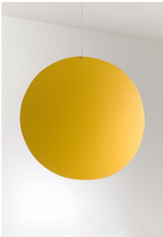
Antonio Ballester Moreno. Sol , 2023

Esta vez no nos esperan en Maisterravalbuena únicamente sus pinturas, sino también cerámicas o tapices elaborados con yute o lana, fruto de la aplicación de los lenguajes de la artesanía o del diseño funcional a la pintura o la escultura: sus formas, tonos y motivos continúan siendo los mismos en estos nuevos proyectos, solo que son trasladados a las tres dimensiones, de modo que puedan rodearse y generen sombras. Así, las piezas escultóricas surgieron de procesos parecidos a los de aquellos collages -las dibujó en cartón y terceras manos las calcularon y trasladaron al hierro para ser finalmente pintadas, de nuevo, por el autor-, mientras que los tapices, ejecutados con la técnica del tufting (una pistola pasa el hilo a la tela), nos ofrecen motivos florales a gran escala, con formatos que remiten en buena medida a las vanguardias, estudiadas a fondo por Ballester. En cuanto a los lienzos, veremos en ellos ecos de sus paseos campestres y veraniegos: copas de los árboles que tamizan el cielo, piedras en el camino.