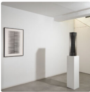
El infinito y Timo Nasseri