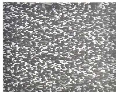
La hija del capitán, 2004